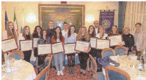
Rotary Gli studenti premiati del Paciolo-D'Annunzio

Per il liceo Classico ha ricevuto il riconoscimento dal Rotary Sa-